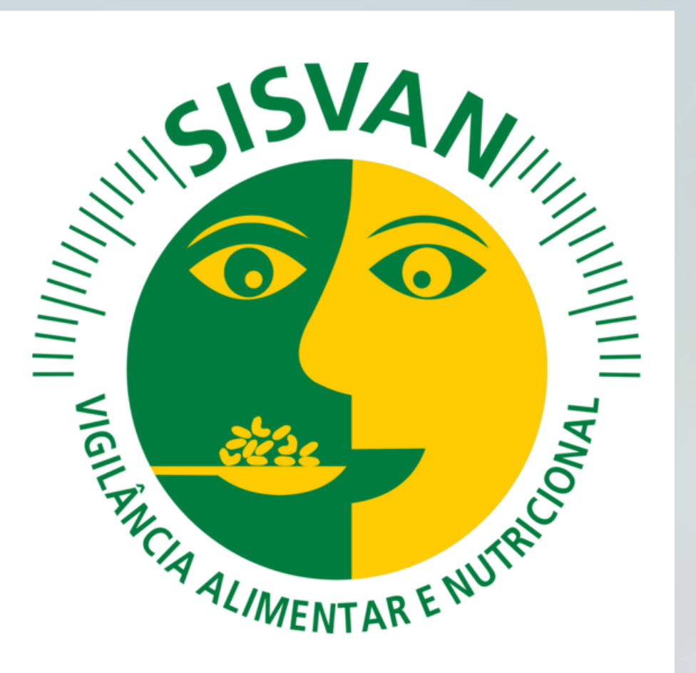
Imagen 1: Logo de Sisvan PNG Vector.

Se trata de un estudio ecológico que utilizó datos del Sistema de Vigilancia Alimentaria y Nutricional (SISVAN) para estimar el estado nutricional de niños menores de cinco años. Las unidades de análisis fueron los estados de las cinco macrorregiones brasileñas. Las variables incluyeron la prevalencia de desnutrición, sobrepeso y obesidad, estratificadas por sexo y unidad federativa. Para la clasificación del estado nutricional, se utilizó el IMC/edad, con los siguientes puntos de corte: desnutrición (Puntuación-Z < -3), sobrepeso (Puntuación-Z ≥ -1 y ≤ +3) y obesidad (Puntuación-Z > +3). Los mapas se crearon con el software R, utilizado para el procesamiento de datos y la representación espacial.